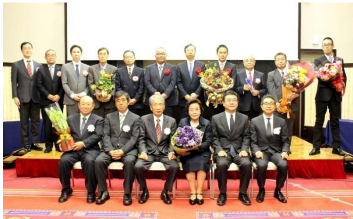
日本フラワー・オブ・ザ・イヤー2015授賞式 (学士会館)