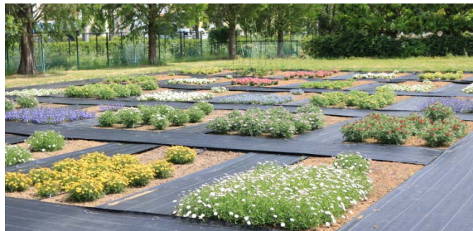
▲千葉大の審査花壇の様子

*千葉大への苗の搬入可能日は、毎週火曜日午前中となります。 (苗の納入日は変更になる場合があります)