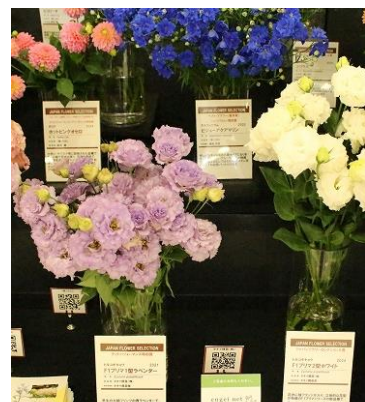
関東東海花の展覧会(2025)の受賞品種PR展示の様子