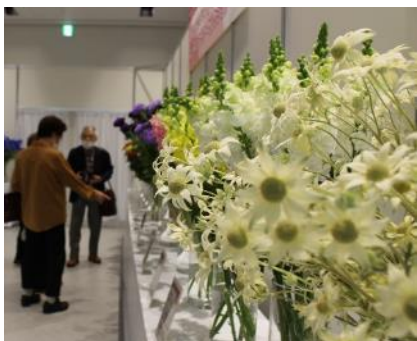
会期中の展示の様子