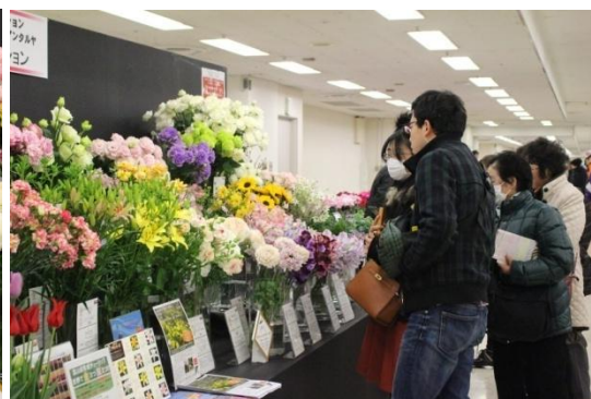
関東東海花の展覧会（2017）の受賞品種PR展示の様子