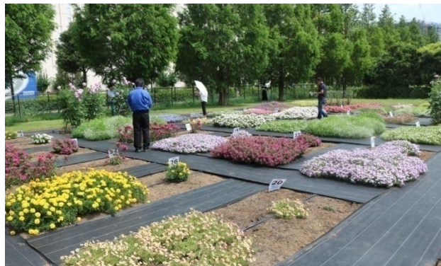
▲千葉大の審査花壇の様子

*千葉大への苗の搬入可能日は、毎週火曜日午前中となります。 (苗の納入日は変更になる場合があります)